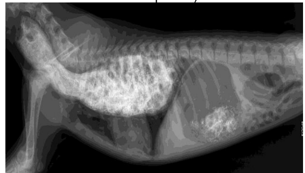
Megaesofag generalizat congenital la câine