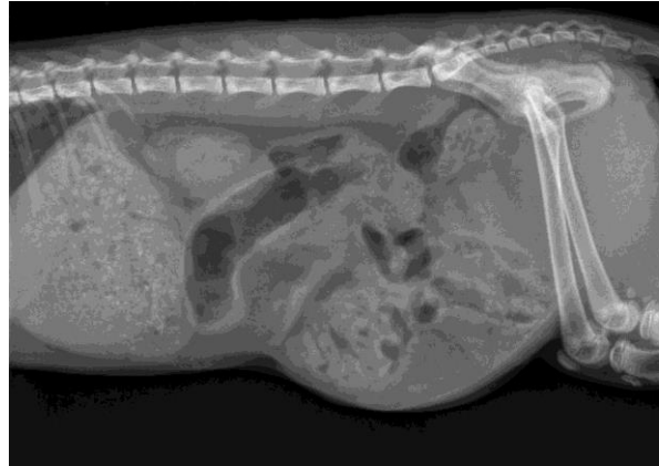
Fecalom la câine

Universitatea de Stiinte Agricole si Medicina Veterinara Cluj Napoca, Calea Aradului 119, Romania