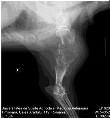
Fractură patologică humerus secundară unei tumori osoase la câine